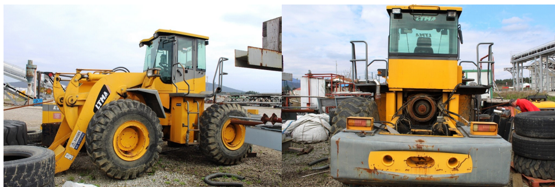
Utovarivač LT 938 sa kliještima za trupce tv.br. TB161130179 R.br.4